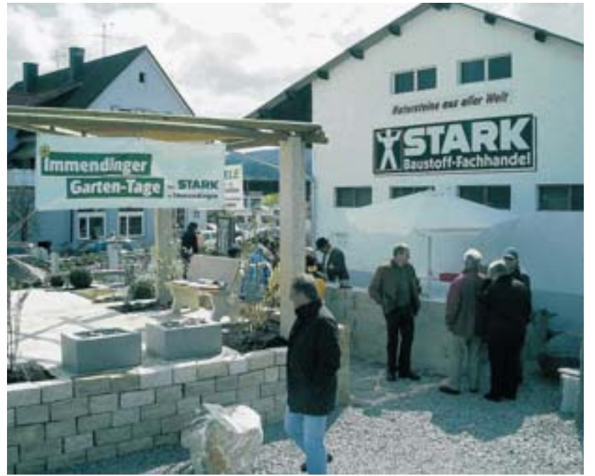
Die neuesten Trends rund um den Garten gibt es bei den fünften Immendinger Gartentagen am 25. und 26. April zu sehen.